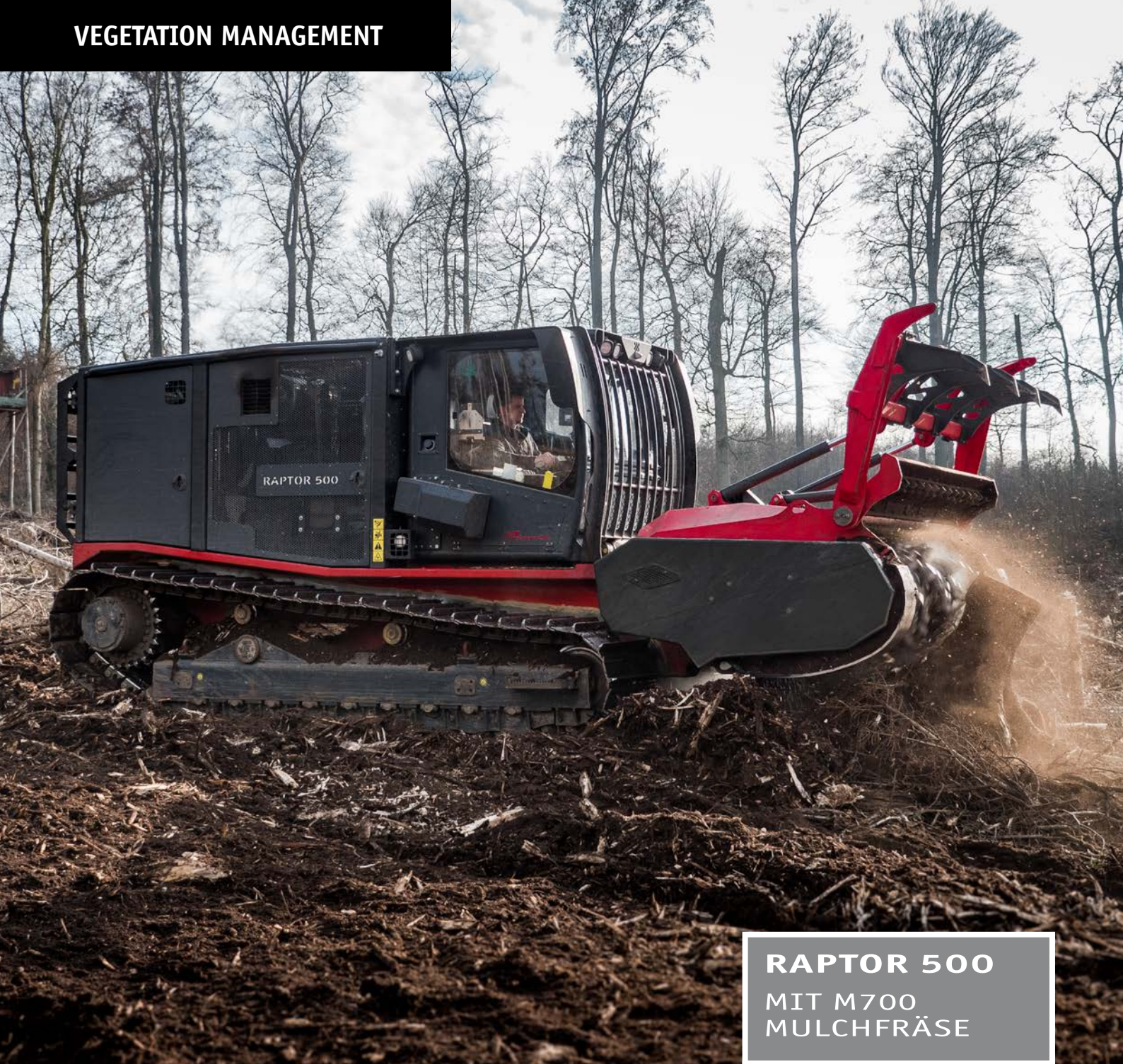
RAPTOR 500 MIT M700 MULCHFRÄSE